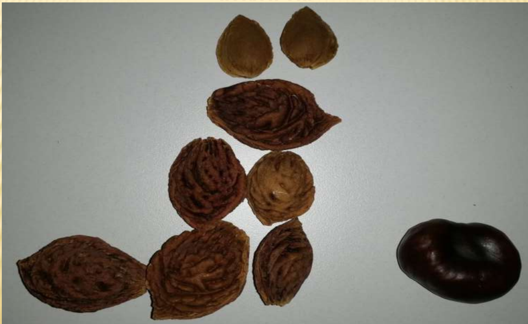
ИЛЛЮСТРАЦИЯ К РУССКОЙ НАРОДНОЙ СКАЗКЕ «КОЛОБОК»